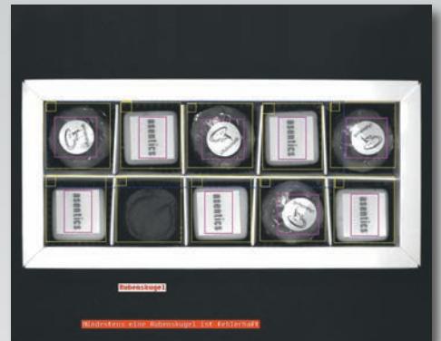
Verpackung wird auf Inlay und Bestückung mit Pirottini geprüft