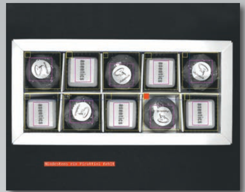
Verpackungsinhalt wird auf Vollständigkeit und Sorten geprüft